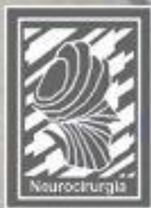
Hospital Municipal Salgado Filho