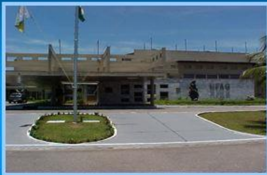
Hospital Força Aérea do Galeão